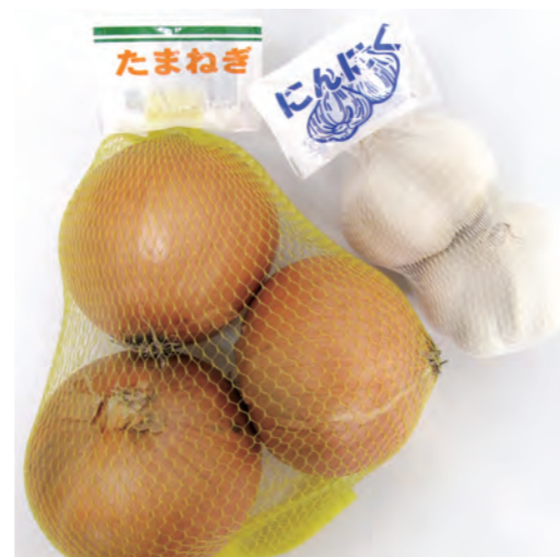
〈たまねぎ〉：ST 80目 折径25cm (Y) 〈にんにく〉：ST 80目 折径25cm (W)