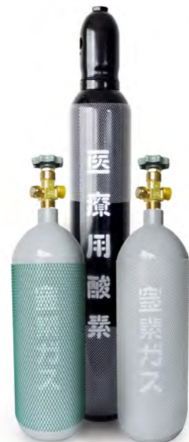
<ボンベ：QN 90目 230φ (LBu)>