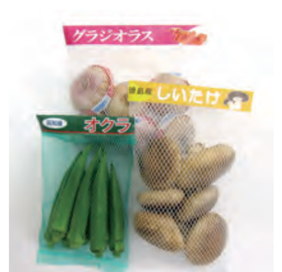
〈オクラ〉：F80 80目 折径105mm (DG) 〈しいたけ〉：F60 60目 折径120mm (W) 〈球根〉：F120 120目 折径150mm (W)