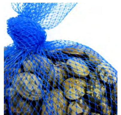
〈アサリ〉：QFLL 90目 折径250mm (DBU)

※表内に記載しているカット寸法や梱包数量は1ケースの目安です。※オリジナルネットをご希望の際は別途ご相談下さい。