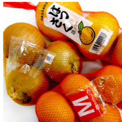
〈はっさく〉：DH 80目 折径25cm (R) 〈みかん〉：DH 80目 折径25cm (R) 〈たまねぎ〉：DH 80目 折径25cm (O)