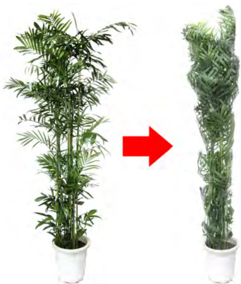
<観葉植物：SKN 180目 折径100cm (W)>