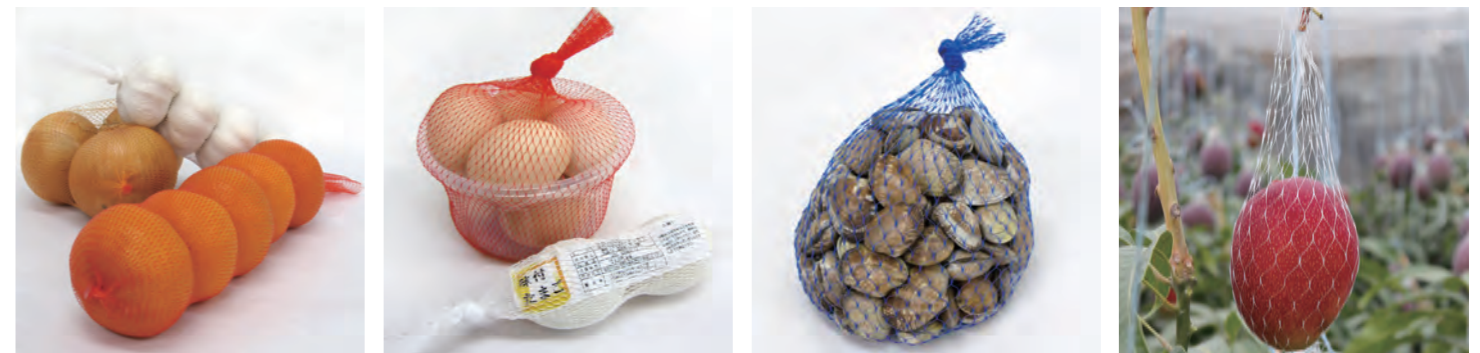
〈玉ねぎ〉：SH 80目 折径25cm (O) 〈にんにく〉：SA 100目 折径23cm (W) 〈みかん〉：SH 80目 折径25cm (R) 〈卵〉：SH 80目 折径30cm (R) 〈ゆで玉子〉：5005 50目 折径5cm (W) 〈アサリ〉：SL 36目 折径35cm (DBU) 〈マンゴー〉：18 18目 折径20cm (N)